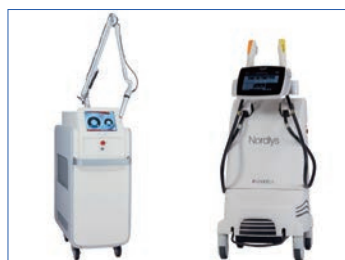
ピコレーザーと12PLノリス

皮膚科・形成外科専門医とともに診療しているクリニックです。スタッフが多く、アットホームな雰囲気職場環境です。看護業務内容は皮膚疾患の診療と処置の介助です。フットケア外来における足の健康指導や紫外線治療器による光線療法。形成外科手術(眼瞼下垂・皮膚癌治療)の直接・間接介助と周術期管理。小児の患者さんが多く、ピコレーザーによる異所性蒙古斑・太田母斑の治療を小児期から行っています。美容皮膚科では県下有数の症例と実績があり、研修も充実しています。各領域において専門性が高い医療を提供できています。ひとりひとりの患者さんの不安を減らし、期待に応えられるような医療・看護をめざしています。