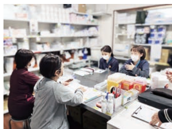
看護カンファレンス

看護師と一緒に悩み、考え、「あなた」と「あなたの大切な人」へサポートと安心を届けます。