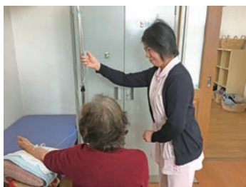
ふれあいを大切に

当院は倉敷市の児島地区にあります。兄弟クリニックモールという形態で診療を行っており、3兄弟の医師(男性2名、女性1名)がそれぞれ整形外科、内科、耳鼻科を担当しています。受付は整形外科と内科耳鼻科で別々になっています。広々とした清潔感あふれる職場で、心のかもったケアと安心・安全な医療を提供できるよう、職員みんなで日々奮闘しています。