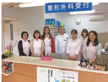
みんなで力をあわせて

患者さんやご家族とふれあい、地域の方々一人ひとりに寄り添いながら看護を行っています。患者さんの病状、家族背景など様々な情報を共有し、患者さんの視点にたった支援ができるよう努めています。