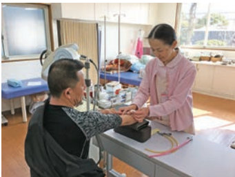
患者さまとふれあい寄り添いながらの看護業務

地域の「かかりつけ医」として、親切でやさしい医療をこころがけています。生活習慣病や慢性疾患の治療、胃カメラやエコーなどの検査、往診や在宅医療に力を注いでいます。糖尿病については、「総合管理医(かかりつけ医)」として、専門医療機関と密接に連携しながら、患者さまごとに丁寧な診療を行っていきたくと考えています。