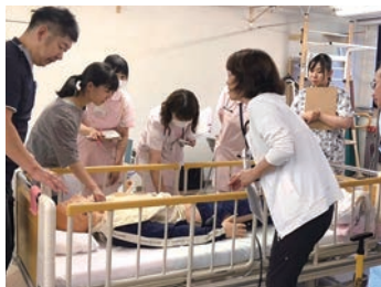
院内勉強会でのワンシーン