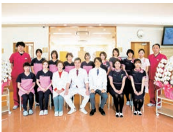
スタッフ同士アットホーム

新人の方、ブランクのある方、経験問わず実践を通して個々の成長に合わせた指導を行っています。スタッフ同士仲が良くアットホームなのでとても働きやすい職場です。