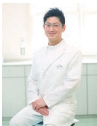
一緒に地域医療に貢献しましょう!

「地域の健康の為にできること、全てを。」を理念に掲げ、内科をはじめ、予防医学の知識とスキルを駆使して、地域の健康を支え続けていきます。職場環境は、ご家族との時間を大切に出来る環境、子育てしやすい環境を実現。一例として、看護師さんが多く在籍、突然のお休みや旅行など長めの休暇を気兼ねなく取りやすい体制になっています。有給休暇6日間連続取得により、最長8日間の休暇が可能。子育て支援など福利厚生も充実しています。みんな仲良く輝いている職場です。詳しくはHPを検索。