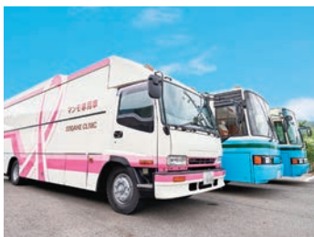
検診車で巡回健診へ

当診療所は、医師・看護師等スタッフ全員で受診者様の情報を共有し、受診者様を第一に考えた対応を心がけています。職員はお客様に常に笑顔で接し何を考えているか、どうすればご希望に添えるかを考え、連携をとりながら診療や人間ドックをはじめとした健康診断に取り組んでいます。看護部門では、採血や様々な処置を行う際、受診者様に寄り添っていけるよう他部門と連携を取り満足していただけるよう努めています。また、当診療所は、医師・看護師を含め5~6人で契約事業所様へ訪問しての検診バスで巡回による健康診断を行っています。