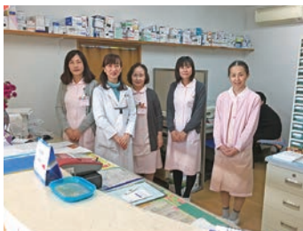
クリニックスタッフ

患者さまやご家族とふれあい、地域の方々一人ひとりに寄り添いながら看護を行っています。患者さまの病状、家族背景など様々な情報を共有し、患者さまの視点にたった支援ができるよう努めています。