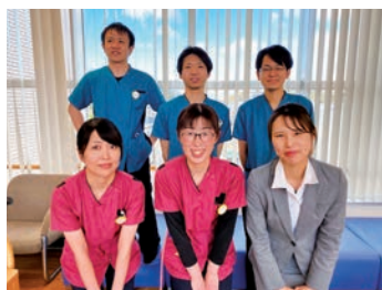
一緒に働きましょう

有床診療所として、救急の受け入れとともに、地域の施設と連携を密に行い、地域医療を中心とした看護を行っています。一人一人の患者様、ご家族様に、肉体的・精神的・社会的なトータルの支えができるよう努めています。