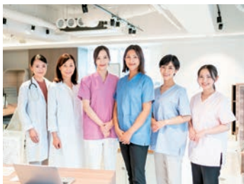
健康を支えるスタッフ、一緒に働きましょう

大ヶ池診療所は、検診車による巡回健診を実施する機関です。健診は日々違う場所で実施し契約事業所様それぞれの要望に合わせた健診を行っています。