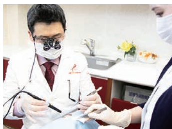
外来手術のイメージ

美容皮膚科の施術を行います。肝斑・シミ取りに有効なピコレーザーと12PLノリス、痛みの少ない医療脱毛と、DENSITYによるしわ・たるみ治療です。アンチエイジング提案とカウンセリングも行います。学会や研修会に積極的に参加して、最新の知識・技術の習得ができます。