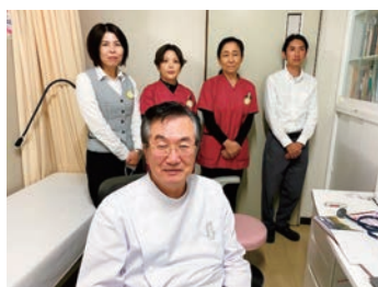
アットホームな職場です

当院は、有床診療所(19床)として、在宅療養支援診療所・救急告示医療機関・肝炎一次専門医療機関の認定も受けており、地域連携バス(大腿骨頸部骨折・脳卒中)、がん診療連携や人工透析・CAPD・大腸内視鏡・胃内視鏡・禁煙外来の診療も行っています。また、在宅医療や訪問診療を積極的に行い、リハビリによる骨折予防をはかり、在宅復帰率を上昇させるとともに、病診連携、医療介護多職種連携のもとに、地域包括ケアの実現をはかり、患者様が安心して生活出来るよう見守っていきます。