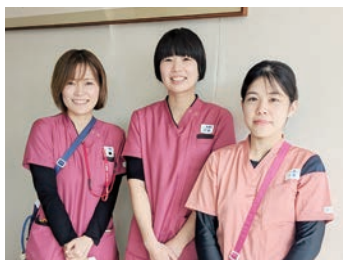
私たちと一緒に働きませんか

看護部は「地域住民にとって信頼できる看護・介護を目指す」を理念に、高い倫理観や専門的知識・技術を習得するために学ぶ姿勢を持ち続けること、患者さんやご家族に寄り添うことに努めています。