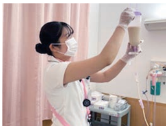
たくさんのことを日々学んでいます!

個性性が求められる慢性期看護領域において一時的な治療期間の支援だけでなく、その人の人生そのものを支える看護を大切にしています。専門性の高い看護を提供できるよう、院内認定専門領域看護師制度を設け、特定領域における看護師を育成しています。専門性の追求とチームで支える医療・看護を大切にし、信頼される看護を目指しています。