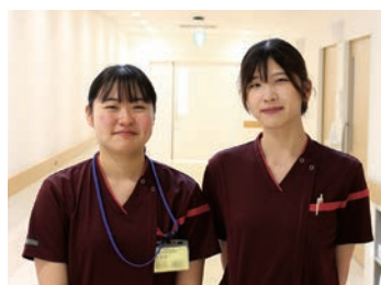
新人ナースも一緒に頑張っています!

健診から在宅までを支援できる病院として、地域に密着した医療を提供しています。内科を中心に13の診療科を標榜しており、産婦人科、小児科を有する地域で唯一の病院として、周産期・小児医療の中心的役割を担っています。また、真庭圏域の災害拠点病院として、災害時には地域を守り、被災地にはDMATを派遣しています。「一人ひとりの患者さんを大切に、安全で質の良い看護サービスを提供します」の理念のもと、優しく丁寧な看護を心がけています。令和3年6月に新病院に新築移転しました!ピカピカの新しい病院で一緒に働きましょう!