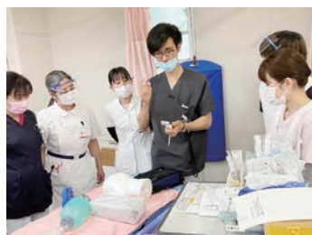
気付き・学び深めることができる!