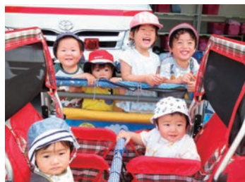
託児所「みどり園」の様子

生活とのバランスを考慮しながら、やりがいを持って働くことができるように託児所の完備、継続教育の充実、職員寮の設置、職員旅行、時間短縮勤務など、様々な取り組みがあります。あなたの力を発揮していただくことが、地域の人々の安心な生活を支えます。