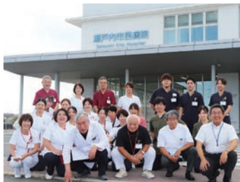
多職種連携がばってます