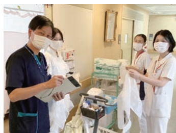
一緒に働きましょう

当院は、地域住民に信頼され地域に根差した医療の提供を目指している、地域包括ケア病棟55床の病院です。看護部理念である「患者が主役の看護」を軸に関連部署との連携を図り、チーム医療を推進し継続看護に努めています。地域の中での看護師の役割を認識し、知識・技術だけでなく豊かな人間性を身につけていく努力を続けています。看護職員一人一人が生き生きと働くことができるよう、ワーク・ライフ・バランスにも取り組み、長く仕事を続けることができる環境づくりに努めています。