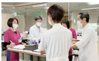
多職種カンファレンス

新入職者教育は、その方にあったサポート体制で支援します。新人看護職員研修は、急性期病院との教育連携を図り、ガイドラインに沿った研修を行っています。また、看護協会加入・院外研修・学会参加・資格取得の支援・奨学金制度等の福利厚生も充実しています。