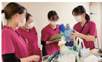
新入職者研修(患者の急変時対応)

また、病院と併設している訪問看護ステーション・訪問介護ステーション・通所リハビリステーション・居宅介護支援事業所、近隣施設との連携を図り、入院から退院後の生活支援にも積極的に取り組んでいます。自分の得意分野で活躍できます。やりがい感を実感できる職場づくりを目指しています。