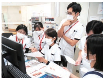
チームカンファレンスの様子 新人看護師も先輩看護師も一緒に学び成長できる職場です

中四国で唯一の脊髄損傷者のリハビリテーション医療施設だからこそできる看護。脊髄損傷についての専門的知識が深まり、障害のある方の社会復帰を見据えたセルフケア自立への援助、合併症予防、自己管理指導等専門的な看護を修得できます。