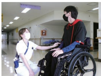
看護が実感できるやりがいのある職場です

また、吉備中央町を中心とした地域医療も担っており、地域の人々が安心して暮らし続けられるよう、貢献しています。