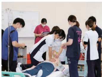
救急救命のシミュレーション研修

瀬戸内市唯一の急性期病院として24時間365日2次救急の受け入れをしています。また、地域包括ケアシステムの中核病院として急性期、慢性期、在宅のすべてにおいて幅広い医療・看護を担っています。