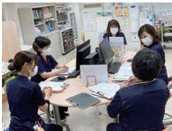
カンファレンスの様子

当院は、備前焼で知られる備前市にある公立病院です。高齢化が進む地域のニーズに応えるため、昨年、療養病床を増床しました。患者様やご家族様の声に耳を傾けながら、看護部の理念「患者さまの人権を尊重し、信頼される看護を提供します」に基づき、質の高い看護の提供に努めています。離職者が少なく、子育て中の看護師から経験豊富なプラチナナースまで、幅広い年齢層の看護師が活躍しています。