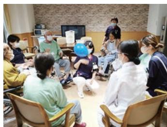
院内デイケアの様子

ここ2年ほどは再就職で戻ってきてくれるスタッフが増えました。「人間関係が良好なことが再就職の決め手です。私の年齢になり仕事内容のストレスよりも人間関係のストレスが少ないのがいい!と思っていたからです。」と答えてくれました。うれしいの一言です。