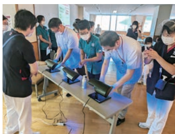
手指衛生の基本と実践

新採用職員が安心して働ける環境作りと指導者養成研修を修了した担当者がサポートします。個々で取り組むeラーニング研修や集合院内研修、認定看護師や専任看護師の支援も行っています。