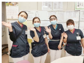
チームワークよく♡

当院は真庭医療圏で唯一のDPC対象病院であって、一般急性期病床、地域包括ケア病床、療養病床を併せ持つケアミックス病院です。「地域の皆さまに、あたたかく質の高い看護を提供します。職員一人ひとりを大切にする職場環境を推進します。」の理念のもと、看護のやりがいを大切にし、専門職としての技術の提供とやさしさを兼ね備えた看護職を目指して成長していけるように取り組んでいます。勤務は多様な形態を取り入れ、スタッフが働きやすい環境を工夫しています。福利厚生で食事も低コストで美味しいと好評です。