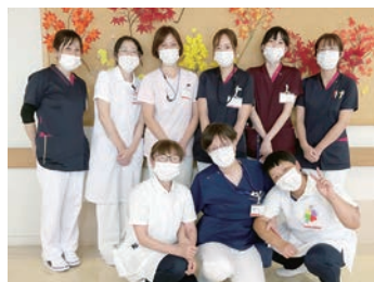
個々のやりたいことが実現できる

鏡野町、津山市西部及びその近隣地域の中核医療を担い「心のかよった最良の医療提供を」の理念のもと、高齢化の進む地域に密着した公立病院です。患者層は子供から高齢者まで幅広く、身近な病院として親しまれています。看護部理念である、安全で安心できる看護の充実を目指し、患者さんを尊重し、温かい手を差し伸べるべく日々研鑽しています。病院建て替えを計画しており、令和10年の完成を目指し職員一丸となり取り組んでいます。