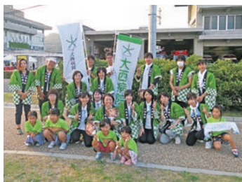
活気のある職場です

専門性の高い検査・治療を提供し、地域の方々の健康を守り、人と人との触れ合いを喜びとし、安心と信頼に支えられた病院を目指すことを理念としています。地域包括ケア病床を44床とし、在宅サービスとも密接に関わりながら、地域包括ケアシステムを中心とした、より地域に密着した医療と介護を提供しています。