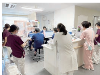
変わり続ける環境で、成長を。

薬師寺慈恵病院は、急性期治療から慢性期・療養、在宅支援まで切れ目のない医療を提供する地域密着型の二次救急病院です。現在、新病院建設が進んでおり、より安全で快適な医療環境の実現をめざしています。看護部は「ともに学び、ともに支える看護」を理念に掲げ、救急から慢性期ケアまで幅広い看護実践を大切にしています。救急看護認定看護師・認知症ケア認定看護師が中心となり、全スタッフを対象にした教育体制を整備している最中で、eラーニング等も活用しながら、誰もが確実にスキルアップできる環境づくりを進めています。