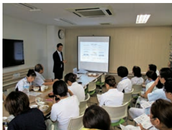
ランチョンセミナーの風景

すべての職員が自らが中心となつて、「働きやすい職場」そして「働きがいのある職場」を目指し、仕事のやりがいと同時に、仕事以外の生活でも充実感が得られる「仕事と家庭」「病院と個人」の調和のある病院作りを行っています。