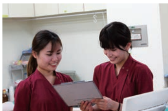
親切に指導しています

精神科病院としての通常外来に加え「物忘れ」「発達障害」「アルコール」などの専門外来を設置し診療体制の充実を図っています。また地域精神医療にも力を注ぎ保健所・児童相談所・学校などと幅広く連携をし当事者支援や家族支援にも取り組み在宅での療養支援も積極的に行っています。看護部では精神科医療を担う一員としての自覚を持ち、信頼される質の高い看護を提供するべく教育体制を整えています。自主的な活動を支援する制度により、資金援助を受けながら個人のスキルアップが可能です。