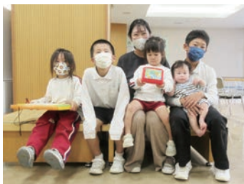
子育てと仕事 がんばっています。

子育てや家庭などの私生活と仕事バランスよく充実するように、子の看護や介護休暇など特別休暇制度があります。職員同士も仕事や子育てなどの相談ができ、明るく働き続けることのできる環境です。