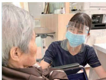
「楽しく看護」病棟で活躍する看護師たち

当院は、総社市駅前であり、地域の中核病院として二次救急の対応を担っています。安全・安心な療養環境を提供し、地域の皆様に愛される病院をめざしています。つきましては、2024年以降、急性期医療に対応すべく看護体制を強化し、入院から退院後、住み慣れた地域での在宅復帰に向けてのサポートにも注力しています。病院機能の肝要をつかさどる看護師は、思いやりと豊かな心でひとり一人の患者さんに寄り添い、地域の皆様に信頼される看護の提供に努めています。