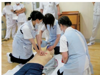
3人の呼吸がぴったし

病院創立から90年を向かえようと、時代の変革に対応しつつ急性期は勿論のこと慢性期を中心とした包括医療に取り組んでいます。地域のニーズに柔軟に対応するため介護医療院及び訪問看護ステーションを併設しています。また、機能維持、回復を目的に短時間リハビリに特化した通所リハビリセンターを運用しています。人生100年時代を見据え日常生活の維持向上を目指し、医療、介護の両面からサービスの充実を図り、地域に「なくてはならない病院」として安全で安心な医療・介護に努めています。