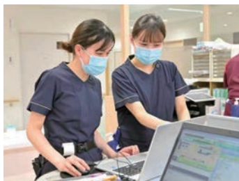
教育支援は、プリセプター制で安心

患者さん、ご家族の意向を尊重した適切な退院支援に繋げるために定期的にカンファレンスを開催し、多職種連携によるチーム医療を実現しています。看護師の看護のチカラはここでも大きく発揮しています。