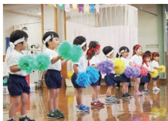
ひよこルームで運動会! 毎日喜んで通園します