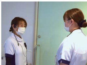
先輩看護師と共に学び成長を！

プリセプター制を導入しており、細やかに技術面・精神面等の支援を行っています。また入職後全病棟、外来、透析センターのローテーション研修を取り入れたり、看護技術取得のためeラーニング受講や集合研修を行い、安心して働ける職場環境に努めています。