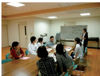
自主学習グループの様子

プリセプター制による新人看護師サポート、クリニカルラダーも一新し、よりクラス別の目指す姿、習得スキルが明確になりました。院内、外部研修などに参加して、スキルアップを目指しています。資格取得のための奨学金制度や資格取得後の奨励金制度があります。