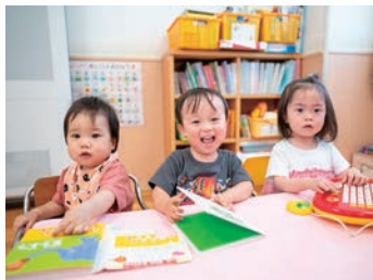
我が家のサポーター！ 今日は病児保育ですごします

当院は県南西部に位置し、地域に根ざした病院として医療と介護の両面から地域への貢献を目指しています。笠岡湾に面した風光明媚な景観やホスピタルアートは職員の自慢です。入院は急性期一般病棟・地域包括ケア病棟を有し、小児から高齢者までの専門性を活かした幅広い看護を提供しています。2025年1月より新手術棟が竣工、さらなる貢献を目指しています。また、隣接の瀬戸ライフサポートセンターは退院後の在宅生活支援まで集約し、地域のみなさまの「豊かな健康と暮らし」をお守りします。