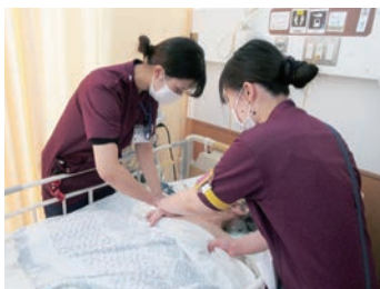
ともに成長していきます。

へき地医療拠点病院として、高梁市西部地域を中心に小児から高齢者、急性期から慢性期の幅広い医療を担っています。看護部の理念「安全で安心な看護を提供し、患者さんにやさしく寄り添いながら回復力を高めるよう支援します。」のもと、地域の方々の思いに耳を傾け、患者さん・家族の自己決定を尊重し、寄り添いながら看護ケアを実践しています。また院内・院外研修、学会発表、資格取得など看護部一人一人に合ったスキルアップ・キャリアアップを支援しています。