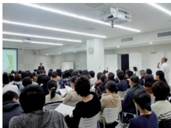
研究発表会の様子

急性期医療と回復期を支援する医療、また、全世代の方への予防医療を提供し、幅広い患者様のニーズに応えられる病院を目指しています。看護部の理念として「地域の皆様に寄り添い、満足していただける安全で安心できる看護を提供します。」を掲げ、質の高い看護が提供できるよう日々努めております。また、救急受入体制の強化や外来化学療法、禁煙外来などの専門医療に力を入れるとともに、出前講座や病児・病後児保育の受け入れなど、地域の皆様とのかかわりも大切にしています。