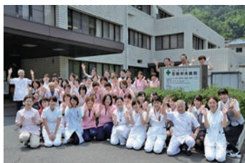
ともに学び、意見交換しながら 成長しましょう!

当院は、地域包括ケア病床を有し、在宅や介護施設で安心して生活できるよう支援しています。「地域に根ざした医療」「心の通い合う看護」の理念に基づき、地域の方々のニーズに合った対応ができるよう医療、介護サービスを提供。「笠岡になくってはならない病院づくり」に努め、専門スタッフと関連施設との連携をとり、垣根を取り払ったケアを展開「ここに来て良かった」と、安心と信頼が得られるよう努力しています。職員の働き方もワーク・ライフ・バランスはもちろん、気軽に相談できるアットホームな環境で支えます。