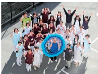
みんなでサポート

休職期間が長い方でも新人さんでも、各部署基礎からの指導体制があります。明るい職場で、経験豊富な看護師が看護の内容はもちろん、子育てや親の介護についてなど、色々な経験からアドバイスをしてくれます。