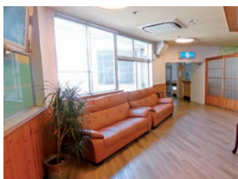
病棟内はあたたかな空間に包まれています

昭和59年5月に開設された日本で初めての認知症専門病院です。入院による環境の変化は認知症の方には大きな負担となります。認知症の人々の心や生活を大切に、安心して生活できるような環境づくりを行い、すべての職員が「認知症の人々のために」をモットーに医療・看護・介護が一体になった生活療法を実践しています。また、職員一人ひとりとも向き合い笑顔で長く働けるようワーク・ライフ・バランスにも積極的に取り組んでいます。