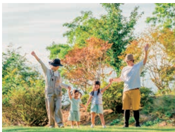
ワークライフバランスを大切に

地域包括ケア(在宅復帰支援)に取り組み、入院中は生活動作のリハビリなどを積極的に行います。退院時には施設利用やリハビリなどについて、社会福祉士や退院支援看護師がご相談に応じ、在宅復帰をサポートします。