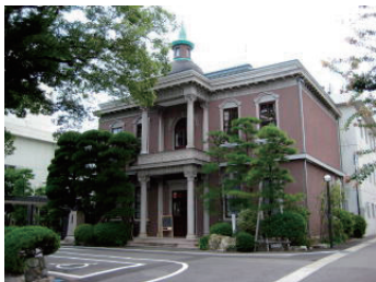
名医を慰留せしめた名館

入職時には、どの職種も2～3週間をかけて各部署を回り、オリエンテーションを受けます。小規模であるからこそ、多職種の理解と多職種との良好なコミュニケーションでチーム医療を充実させています。