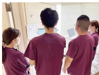
ともに考える、成長の時間。

新病院の建設が進む今、働く環境だけでなく看護体制そのものを再構築しています。急性期から療養まで幅広い看護を担う当院だからこそ、動線・設備・教育を含めて“より学びやすく、働きやすい病院”を一緒に創っていきます。未来志向の看護が実現できる職場です。