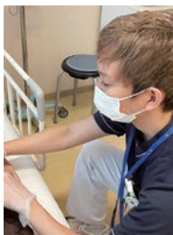
専門性を生かした看護実践

PNSを導入しています。互いに足りない部分を補い合えるパートナーと看護を行い、互いに学びあうことができます。新人看護師はフレッシュパートナーとして3人目のパートナーになります。常に2人の看護師から指導を受けることができるので安心感があります。