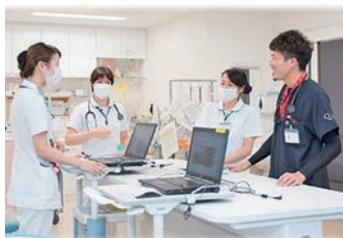
若い職員が多く明るい職場です

令和6年増築工事が完了し、泌尿器科と婦人科(健診)の診療が開始しました。診療が開始になる前に勉強会を行い情報共有と知識の向上を図りました。前向きに新しいことへチャレンジしています。