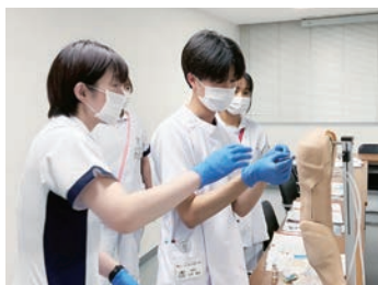
新人看護師研修の様子

看護部では、「人間性を大切にする」を理念に掲げ、患者さん1人1人のニーズに応えるべく個別性のある看護を行っています。患者さんが住み慣れた家で暮らせるように退院支援にも力を注いでいます。