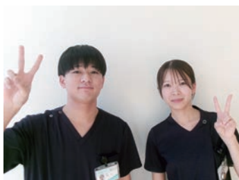
日々頑張っています!

個々のライフスタイルに合わせた働き方が可能な職場です。当院は様々な科があるため災害看護などに活かすことが出来ます。災害看護だけでなく、緩和ケアや訪問看護等、自分の働き方を一緒に見つけませんか。