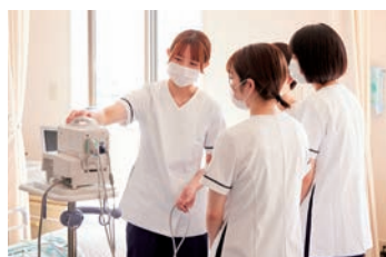
先輩看護師との学び

急性期病棟、回復期リハビリテーション病棟、地域包括ケア病棟で急性期から社会復帰まで、よりよい医療と看護サービスを提供しています。安心して在宅生活ができるよう訪問看護ステーション等も併設しています。患者家族の皆さまが「この病院に来てよかった」と実感していただけるよう、質の高い看護を提供しながら確かな知識、技術、倫理観を持った看護師の育成を心がけています。また看護に取り組む上で看護職員全員がやりがいを持ち、結婚出産後も安心した復職ができるよう、個人のワーク・ライフ・バランスを考慮した環境を整えています。