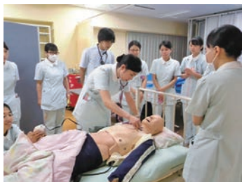
他施設合同新人看護職員研修

岡山県北における救命救急・急性期からターミナルまでハイレベルの医療の提供と、地域医療支援事業の充実を目指しています。「働きやすい、働き続けられる職場環境の整備」を推進しており、ハラスメント対策や残業時間の削減のための業務改善に取り組んでいます。その一環としてユカリアタッチ・バイタル連携システムが導入され、看護師の負担軽減につながっています。私達は患者・職員・地域の3つの満足を目指し、医療のプロとして挑戦を続けます。人が好き・看護が好き、チャレンジ精神旺盛な方を待っています。2023年7月、県北初の緩和ケア病棟も開設しました。