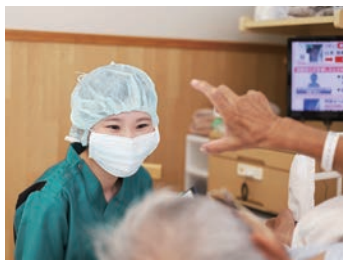
安心してください！ 手術の時は私がついていきます

当院は病児保育があります。発熱、インフルエンザなどでも預けて仕事が出来ますよ。保育料の補助、病児保育、予防接種は子どもは半額で受ける事が出来ます。補助は充実！安心して働けます。