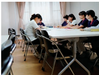
勉強会チームのミーティング

東京帝国医科大学を卒業後、地元にて請われて帰郷した、当時最先端技術を熟知した内科医の中島琢之が再び東京行きとなった際、琢之を慰留するため友人の銀行家・妹尾順平氏が先頭となって、理想の病院をと大正6年に建てたのが城西浪漫館(中島病院日本館)です。国登録有形文化財に登録されています。