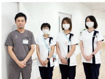
新しい力が加わりました

当院は昭和21年の開業以来、かかりつけ医として、地域に根ざした信頼される医療機関を目指してきました。看護部では当法人の理念の根源である「医療・看護・介護の基本は“人”であり、古来より赤ちゃんを慈しむ母の手にある」という思いを実践するため、職員個々の生活も大切にしながら、患者さん・ご家族の笑顔を看護の喜びとし、日々努力を重ねています。病院は地域包括ケア病棟38床と療養病棟30床で、併設の施設として老人保健施設50床と通所リハビリ、訪問看護ステーション・居宅介護事業所を有しています。