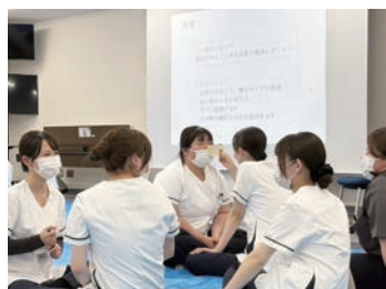
互いに学び、高め合える仲間に

新卒看護師の教育は看護実践能力と指導力を兼ね備えたティーチングナースを中心にを行っています。中途採用看護師には能力に併せた教育支援をしています。看護職員全体が共にスキルアップを図り、高め合う環境づくりに取り組んでいます。