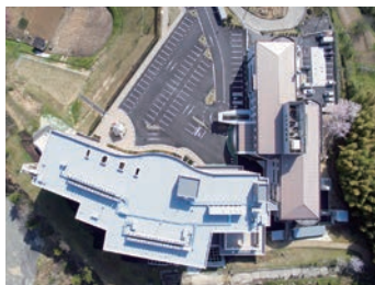
ホームページの職員募集情報もチェックしてみてください♪

四季折々の自然を一望できる6階建ての病棟設備は新しく、他の設備もリニューアル完了。広々とした病棟は見晴らしに優れ、安心できる療養環境と職場環境を両立し快適です。また、医療機能面でも、より便利に看護業務が行えるよう無理のないICT化を推進しています。