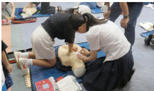
看護進路ガイダンス