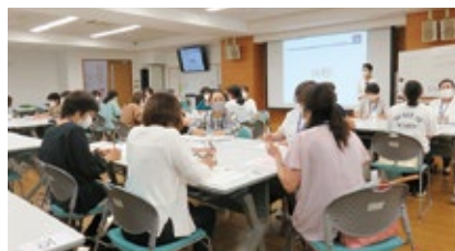
訪問看護師養成講習会