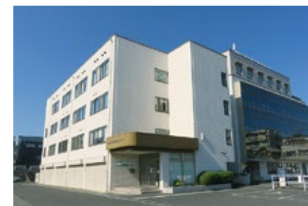
※ナースセンターは研修センターの3階にあります。