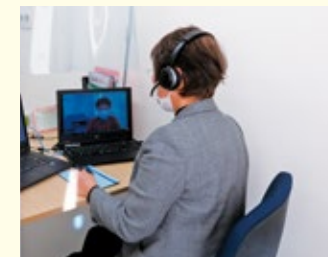
岡山県ナースセンターでの就業相談(オンライン就業相談)