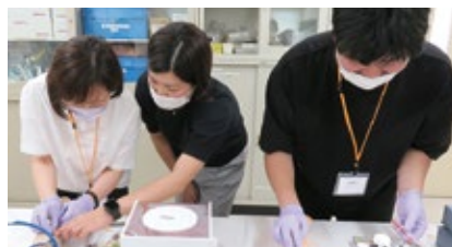
職場復帰のための看護技術講習会