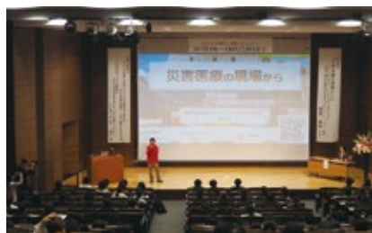
「看護の日・看護週間」看護大会