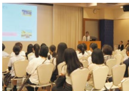
「看護進路ガイダンス」