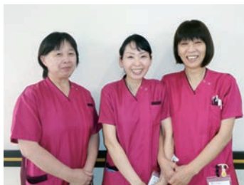
笑顔あふれる職場です

新規採用者には1対1で指導を行っています。具体的には看護業務チェックリストを用いて自立度を確認していきます。1か月、3か月、6か月、1年と反省会を行い、日々の成長と新入職員の問題点を明確にしていきます。