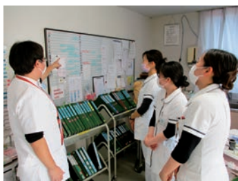
先輩からの指導の様子

新入職者や中途採用の方には、プリセプターを中心に個々の能力に応じた指導体制で、キャリアアップを図っていただいています。チーム全体でのサポートを通じて安心して働くことができます。院内・院外研修への積極的な参加を通じて、看護知識や技術の向上に努めています。