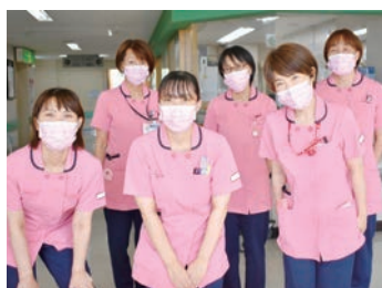
わきあいあいとした職場です

地元かかりつけ病院として、日常的な疾患、外傷から一次・二次救急、糖尿病や循環器の専門医の配置や整形外科の手術対応を行い、地域に密着した医療の提供を行っています。介護部門では、訪問介護・看護、通所リハビリテーション、訪問リハビリテーションなど、要介護状態になられても、ご自宅で安心して生活していただけるサービスの提供に努めております。「患者様だけでなく、ご家族と向き合い共感する気持ちを大切に接すること」を看護部理念とし、専門職として長く働き続けられる環境を築いています。