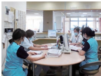
カンファレンスの様子

小豆島と日生諸島に囲まれた病院の窓から望む朝日と穏やかな海、鮮やかな山の緑は患者さんのみならず、スタッフの心も癒してくれます。当院は地域密着型の病院であり、地域の皆さんが医療を継続して受けることができ、安心して暮らしていけるよう看護に取り組んでいます。小規模病院だからこそ患者さん・その家族との相互関係を築くことができ、多職種と一緒に温かく親しみのあふれる医療の提供を行うことを目指しています。病院全体のスタッフが明るく、患者さんと共に笑顔が多い病院です。