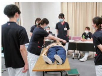
みんなで成長しましょう!

当院は真庭医療圏で唯一のDPC対象病院であって、一般急性期病床、地域包括ケア病床、療養病床を併せ持つケアミックス病院です。「地域の皆さまに、あたたかく質の高い看護を提供します。職員一人ひとりを大切にする職場環境を推進します。」の理念のもと、看護のやりがいを大切にし、専門職としての技術の提供とやさしさを兼ね備えた看護職を目指して成長していけるように取り組んでいます。勤務は多様な形態を取り入れ、スタッフが働きやすい環境を工夫しています。福利厚生で食事も低コストで美味しいと好評です。