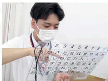
文字盤を使って コミュニケーションをとっています

個性性が求められる慢性期看護領域において一時的な治療期間の支援だけでなく、その人の人生そのものを支える看護を大切にしています。専門性の高い看護を提供できるよう、院内認定専門領域看護師制度を設け、特定領域における看護師を育成しています。専門性の追求とチームで支える医療・看護を大切にし、信頼される看護を目指しています。