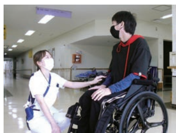
看護が実感できるやりがいのある職場です

また、吉備中央町を中心とした地域医療も担っており、地域の人々が安心して暮らし続けられるよう、貢献しています。