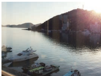
病棟から見た瀬戸内海の景色