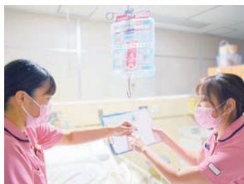
先輩からの丁寧な指導

意欲のある方を万全のサポート体制でバックアップします。教育担当が中心となり、臨床実践能力段階の評価(クリニカルラダー)を取り入れています。また、家庭に合わせた多様な働き方ができ、人間関係の良い働きやすい職場です。