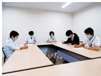
カンファレンス風景

看護課では、ハンセン病後遺症や高齢化による慢性疾患を持ち、療養生活を送っているハンセン病回復者の診療およびリハビリテーションと生活支援を行っています。