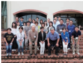
岡山いこいの村での宿泊研修 テーマは「クレームを笑顔に変える」