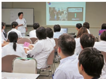
医療安全の研修中