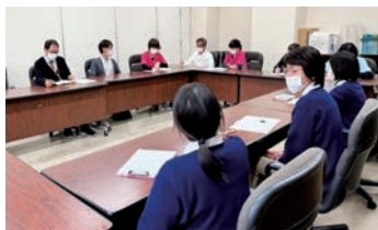
多職種連携カンファレンス (病棟看護師・訪問看護師・ケアマネジャー・ 介護士・OT・PT)

私たちは、地域の方々との在宅医療・看護・介護・生活支援を行います。1回/2週間関連部署の連絡会を実施し、患者様・ご家族様のニーズに対応できるサービス向上を目指して職種間の連携を深めています。