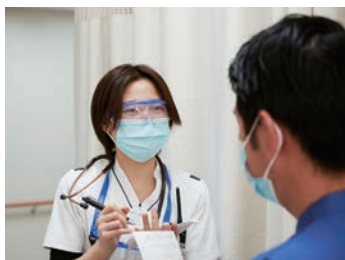
専門職が協力して情報を共有しています。

当院は平成2年4月1日に開院しました。看護部の理念は、「地域の人々の健康を守り、急性期から在宅まで信頼される質の高い看護・介護の提供をすること」です。看護体制はプライマリーナースングで、入院から在宅まで患者さん一人ひとりのニーズに応じたサービスの提供を実施しています。また、学習支援に力を入れており、図書を備えた学びの場を整備し、Web学習用にワークポッド(個室ブース)を設置しています。