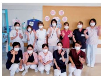
やりがいのある職場です

鏡野町、津山市西部及びその近隣地域の中核医療を担い「心のかよった最良の医療提供を」の理念のもと、高齢化の進む地域に密着した公立病院です。患者層は子供から高齢者まで幅広く、身近な病院として親しまれています。看護部理念である、安全で安心できる看護の充実を目指し、患者さんを尊重し、温かい手を差し伸べるべく日々研鑽しています。病院建て替えを計画しており、令和10年の完成を目指し職員一丸となり取り組んでいます。