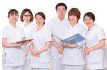
一緒に働きましょう

入所者さんの生きてきた証を聞き取り、その人らしさを尊重したきめ細かな看護を提供できるように努めています。