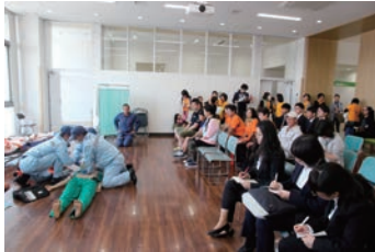
救急救命士による演習を体験