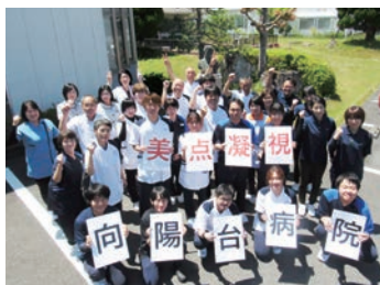
お互いを尊重し合える職場作り

向陽台病院は真庭市で唯一の精神科病院として精神科、心療内科、老年精神科を標榜しています。精神科医療を通して地域との絆を生かし、病院を利用する高齢者や障害・疾患を持った方々が、住み慣れた所で安心して暮らせるよう様々な関連機関と連携しています。看護部はチーム医療の中で、地域や患者様から信頼される看護を目指し患者様との関わりを通して、その人の生き方を尊重して、精神科看護の専門性と豊かな人間性を追求しています。また、すべての職員が生き生きと働けるようにワーク・ライフ・バランスにも積極的に取り組んでいます。