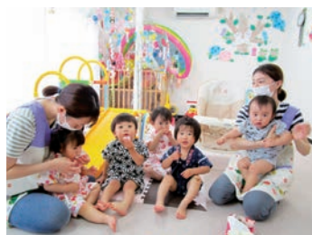
働くママをサポートします

看護師の意見が尊重され、チームの中心役として医療・看護が出来る職場です。感染症病床も2床完備され、安心して感染看護を行うことができます。家庭第一という信念をもとに希望休や勤務体制も充実、子育て中のママには動きやすい職場です。