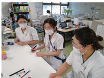
アットホームな雰囲気です

院外研修では看護協会、病院協会等の企画する研修会を受講できる体制を整えています。院内研修では各委員会が中心となり研修会を開催、またeラーニングを導入することによりスキルアップに全員で取り組んでいます。