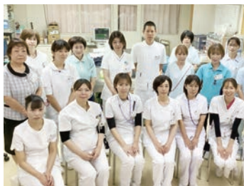
一緒に働きましょう

当院は、地域住民に信頼され地域に根差した医療の提供を目指している、地域包括ケア病床55床の病院です。看護部理念である「患者が主役の看護」を軸に関連部署との連携を図り、チーム医療を推進し継続看護に努めています。地域の中での看護師の役割を認識し、知識・技術だけでなく豊かな人間性を身につけていく努力を続けています。看護職員一人一人が生き生きと働くことができるよう、ワーク・ライフ・バランスにも取り組み、長く仕事を続けることができる環境づくりに努めています。