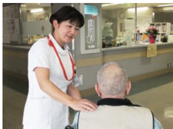
患者様と談笑中のひとコマ

また、看護部では「地域の人々の尊い命と健康を守り、その人らしく生きることを看護を通して実践します」の理念のもと、患者様との対話を大切にし、心の通い合える看護を提供しています。