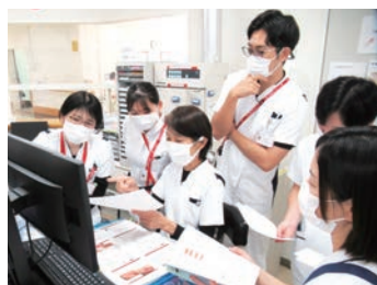
チームカンファレンスの様子 新人看護師も先輩看護師も一緒に学び成長できる職場です

中四国で唯一の脊髄損傷者のリハビリテーション医療施設だからこそできる看護。脊髄損傷についての専門的知識が深まり、障害のある方の社会復帰を見据えたセルフケア自立への援助、合併症予防、自己管理指導等専門的な看護を修得できます。