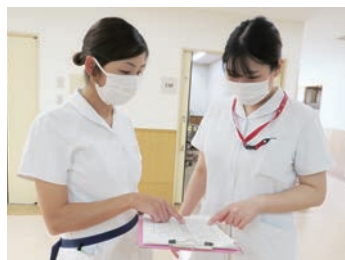
新人看護師個々に合わせて サポートしてくれます!

私が看護する神経筋疾患患者は、構音障害がある人が多く、文字盤や表情、ジェスチャーなど患者個々に合わせたコミュニケーションが必要です。患者との対話を通して、「その人らしく生きること」が支援できるような看護を目指しています。