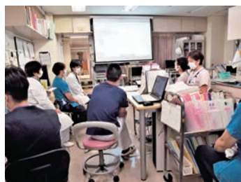
建設的な意見交換の場