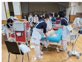
救急(ICLS)研修会の様子

各委員会活動が活発となり、個々のレベルアップを目的にした研修にも積極的に参加しています。院内でも多職種でのカンファレンスが行われ患者様に、よりよい看護が提供できるよう努めています。