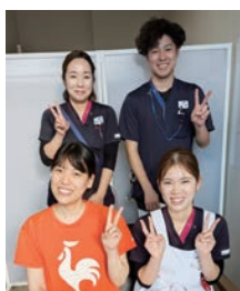
私たちと一緒に働きませんか

看護部は「地域住民にとって信頼できる看護・介護を目指す」を理念に、高い倫理観や専門的知識・技術を習得するために学ぶ姿勢を持ち続けること、患者さんやご家族に寄り添うことに努めています。