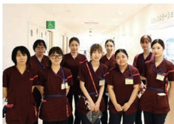
新人ナースも一緒に頑張っています!

健診から在宅までを支援できる病院として、地域に密着した医療を提供しています。内科を中心に13の診療科を標榜しており、産婦人科、小児科を有する地域で唯一の病院として、周産期・小児医療の中心的役割を担っています。また、真庭圏域の災害拠点病院として、災害時には地域を守り、被災地にはDMATを派遣しています。「一人ひとりの患者さんを大切に、安全で質の良い看護サービスを提供します」の理念のもと、優しく丁寧な看護を心がけています。令和3年6月に新病院に新築移転しました!ピカピカの新しい病院で一緒に働きましょう!