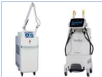
ピコレーザーとI2PLノーリス

皮膚科・形成外科専門医とともに診療しているクリニックです。スタッフが多く、アットホームな雰囲気職場環境です。看護業務内容は皮膚疾患の診療と処置の介助です。フットケア外来における足の健康指導や紫外線治療器による光線療法。形成外科手術(眼瞼下垂・皮膚癌治療)の直接・間接介助と周術期管理。美容皮膚科では県下有数の症例と実績があり、研修も充実しています。各領域において専門性が高い医療を提供できています。ひとりひとりの患者さんの不安を減らし、期待に応えられるような医療・看護をめざしています。