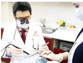
外来手術のイメージ

肝斑、シミ取りに最も有効なピコレーザーとI2PLノーリス、痛みの少ない医療脱毛など美容皮膚科の施術を行います。アンチエイジングの提案やカウンセリングも行っています。学会や研修会にも積極的に参加し、最新の知識・技術の習得ができます。