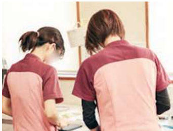
スタッフ同士でダブルチェック

令和4年9月に開院した小児科クリニックです。院長は小児アレルギーを専門としています。小児科非常勤医師も2名在籍しており、小児科は常時2診体制で診療をしています。令和6年4月から内科常勤医師も招聘し、内科診療も本格稼働します。赤ちゃんからご高齢の方まで、地域の方々に信頼される医院を目指し、ひとりひとりに寄り添い、心の通った医療を提供していきます。