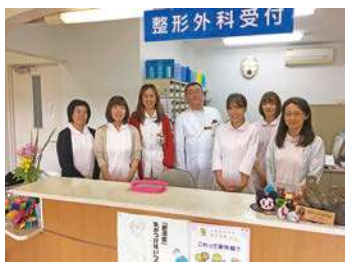
みんなで力をあわせて

患者さんやご家族とふれあい、地域の方々一人ひとりに寄り添いながら看護を行っています。患者さんの病状、家族背景など様々な情報を共有し、患者さんの視点にたった支援ができるよう努めています。