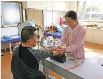
患者さまとふれあい寄り添いながらの看護業務

地域の「かかりつけ医」として、親切でやさしい医療をこころがけています。生活習慣病や慢性疾患の治療、胃カメラやエコーなどの検査、往診や在宅医療に力を注いでいます。糖尿病については、「総合管理医(かかりつけ医)」として、専門医療機関と密接に連携しながら、患者さまごとに丁寧な診療を行っていきたくと考えています。