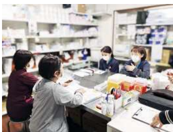
看護カンファレンス

笑顔とチームワークを大切に!! いかなる時も「誠実な看護」の提供を! 看護師と一緒に悩み、考え、「あなた」と「あなたの大切な人」へサポートと安心を届けます。