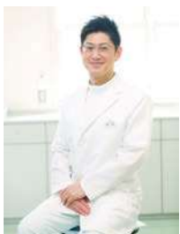
一緒に地域医療に貢献しましょう!

「地域の健康の為にできること、全てを。」を理念に掲げ、内科をはじめ、予防医学の知識とスキルを駆使して、地域の健康を支え続けていきます。職場環境は、ご家族との時間を大切に出来る環境、子育てしやすい環境を実現。一例として、看護師さんが多く在籍、突然のお休みや旅行など長めの休暇を気兼ねなく取りやすい体制になっています。有給休暇6日間連続取得により、最長8日間の休暇が可能。子育て支援など福利厚生も充実しています。みんな仲良く輝いている職場です。詳しくはHPを検索。