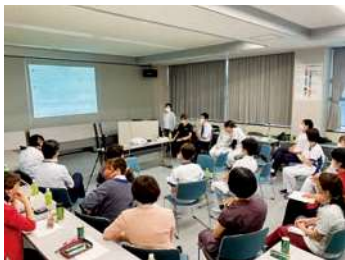
他職種合同ミーティング

〈医療の原点はやさしさ〉を基本理念として、赤ちゃんから高齢者まで、地域における家庭医療と各種専門医療の担い手であり、岡山における在宅ホスピスのオピニオンリーダー。