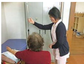
ふれあいを大切に

当院は倉敷市の児島地区にあります。兄弟クリニックモールという形態で診療を行っており、3兄弟の医師(男性2名、女性1名)がそれぞれ整形外科、内科、耳鼻科を担当しています。受付は整形外科と内科耳鼻科で別々になっています。広々とした清潔感あふれる職場で、心のもったケアと安心・安全な医療を提供できるよう、職員みんなで日々奮闘しています。