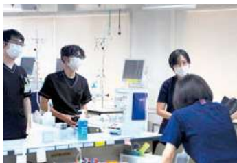
アットホームな職場です

患者さまが、不安やストレスなく、心地よく過ごしていただくとともに、ご家族にも安心して任せていただけるよう、細やかな気配りとコミュニケーションを大切に、日々の看護を行っています。