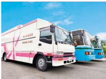
検診車で巡回健診へ

当診療所は、医師・看護師等スタッフ全員で受診者様の情報を共有し、受診者様を第一に考えた対応を心がけています。職員はお客様に常に笑顔で接し何を考えているか、どうすればご希望に添えるかを考え、連携をとりながら診療や人間ドックをはじめとした健康診断に取り組んでいます。看護部門では、採血や様々な処置を行う際、受診者様に寄り添っていけるよう他部門と連携を取り満足していただけるよう努めています。また、当診療所は、医師・看護師を含め5~6人で契約事業所様へ訪問しての検診バスで巡回による健康診断を行っています。