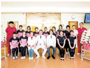
スタッフ同士アットホーム

新人の方、ブランクのある方、経験問わず実践を通して個々の成長に合わせた指導を行っています。スタッフ同士仲が良くアットホームなのでとても働きやすい職場です。