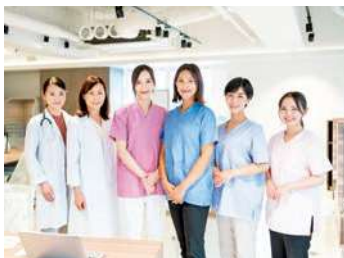
健康を支えるスタッフ、一緒に働きましょう

大ヶ池診療所は、検診車による巡回健診を実施する機関です。健診は日々違う場所で実施し契約事業所様それぞれの要望に合わせた健診を行っています。