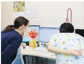
先生と患者さんのカルテを確認

ワクチンや薬剤に間違いがないよう、忙しくてもスタッフ同士でダブルチェックを行い安全・安心を常に心がけています。