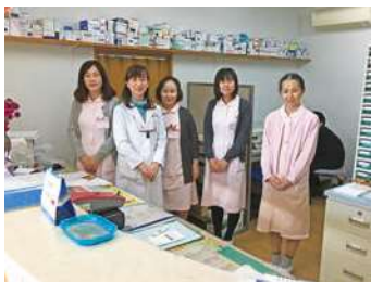
クリニックスタッフ

患者さまやご家族とふれあい、地域の方々一人ひとりに寄り添いながら看護を行っています。患者さまの病状、家族背景など様々な情報を共有し、患者さまの視点にたった支援ができるよう努めています。