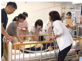
院内勉強会でのワンシーン