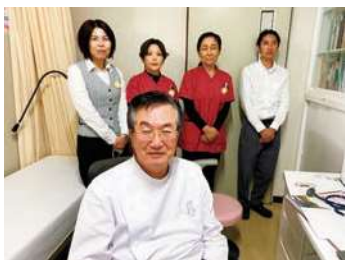
アットホームな職場です

当院は、有床診療所(19床)として、在宅療養支援診療所・救急告示医療機関・肝炎一次専門医療機関の認定も受けており、地域連携バス(大腿骨頸部骨折・脳卒中)、がん診療連携や人工透析・CAPD・大腸内視鏡・胃内視鏡・禁煙外来の診療も行っています。また、在宅医療や訪問診療を積極的に行い、リハビリによる骨折予防をはかり、在宅復帰率を上昇させるとともに、病診連携、医療介護多職種連携のもとに、地域包括ケアの実現をはかり、患者様が安心して生活出来るよう見守っていきます。