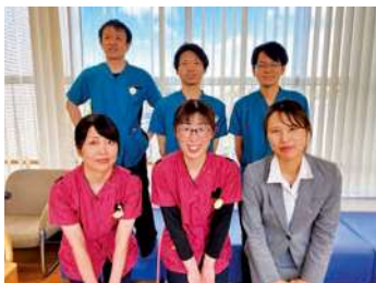
一緒に働きましょう

有床診療所として、救急の受け入れとともに、地域の施設と連携を密に行い、地域医療を中心とした看護を行っています。一人一人の患者様、ご家族様に、肉体的・精神的・社会的なトータルの支えができる人間づくりをしています。