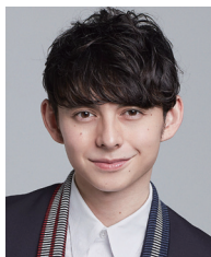
ハリー杉山さん (タレント)

東京都出身 英語・中国語など4か国語を操る卓越した語学を持ち、司会・ラジオDJ・モデルなどマルチに活躍。主な出演番組は、CX「ノンストップ!」、J-WAVE「POP OF THE WORLD」など多数。2012年にイギリス人ジャーナリストの父がパーキンソン病、認知症と診断された。父の介護では感情論が先行し、知識の必要性を感じた。