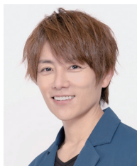
杉浦太陽さん (俳優、タレント)

2001年「ウルトラマンコスモス」で主演を務め、その後も俳優・タレントとして活躍。映画「ウルトラマンサーガ」、ドラマ「てるてる家族」「ゲゲゲの女房」などに出演。Eテレ「やさいの時間」、TBS「ひるおび」などに出演中。07年に辻希美さんと結婚。4児のパパ。