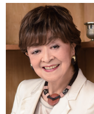
内館 牧子さん (脚本家)