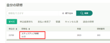
②該当研修をクリック