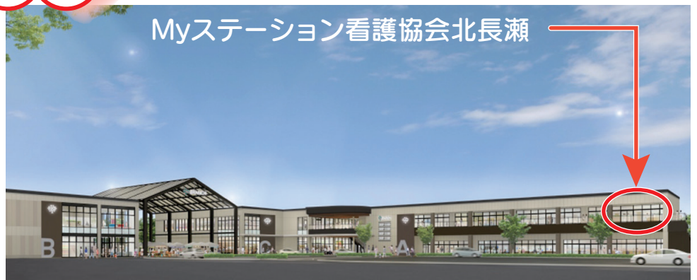
Myステーション看護協会北長瀬